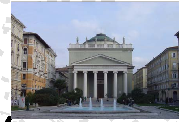
Piazza S. Antonio Nuovo