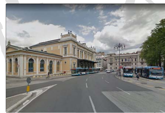
Piazza della stazione (Libertà)